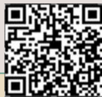
有戶籍就要加健保影片說明