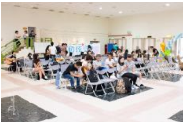
圖3 青永館6F靜軒廳圖（一）