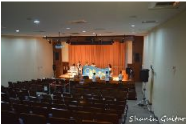
圖1 青永館6F采風堂圖（一）