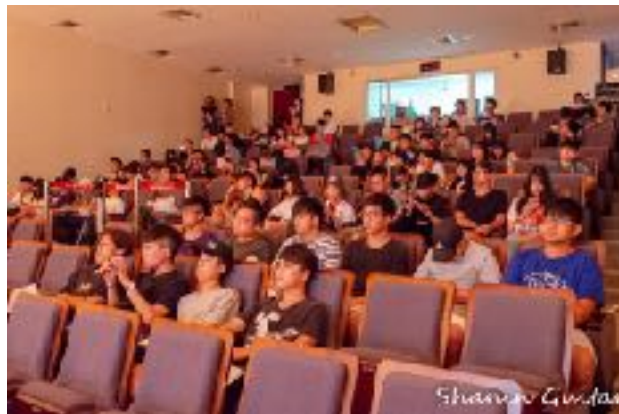
圖2 青永館6F采風堂圖（二）