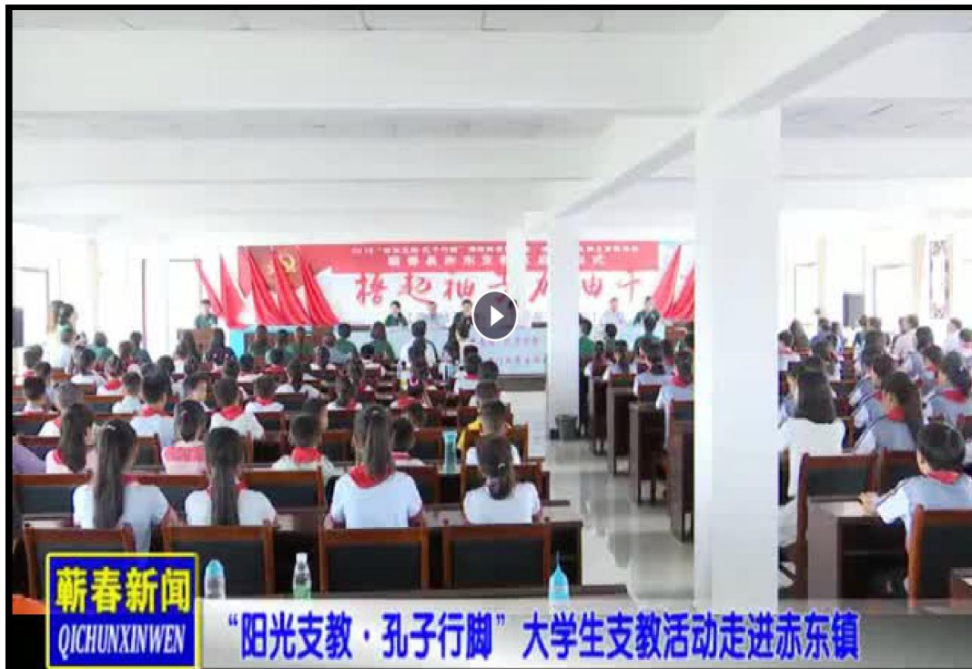
蕲春新闻视频宣传