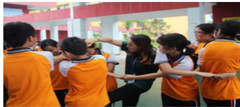
宣恩县教育局宣传

支教活动以开拓学生视野、促进学生快乐成长为宗旨，传播多元文化，实践最新教育理念。五天的支教活动中，支教队员们把知识与实践结合，为三个支教点的小朋友带来各地的民俗文化、语言文化、饮食文化，让孩子们充分感受到各地文化的多样性与趣味性。