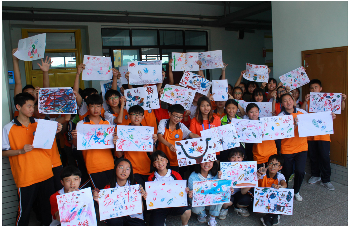
学生课堂成果展示