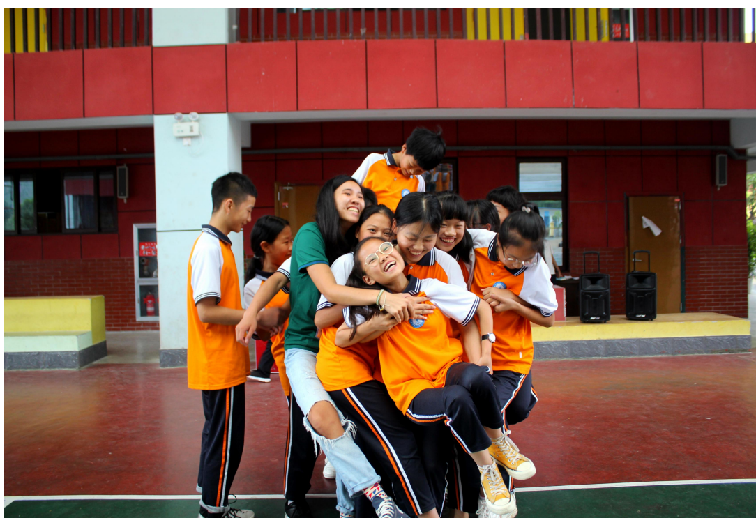
在支教地与当地学生们举行团队建设活动