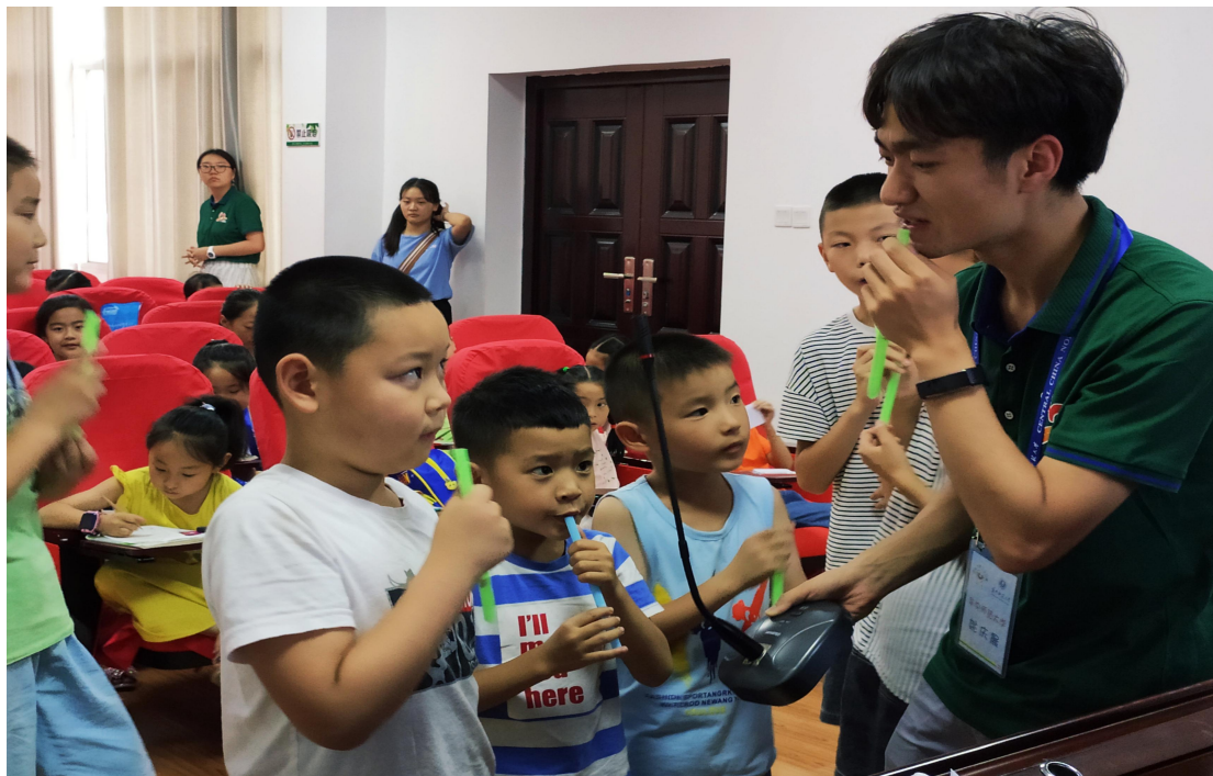
自制乐器-吸管排箫