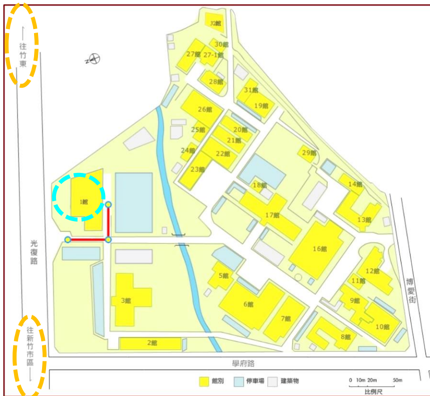
圖二、光復院區內指引圖