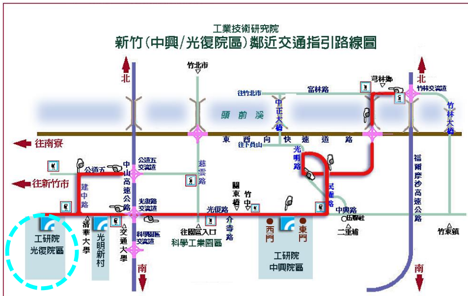
圖一、工研院 光復院區 鄰近交通指引圖

中興院區：新竹縣竹東鎮中興路4段195號 電話：03-5820100 光復院區：新竹市光復路2段321號 電話：03-5721321